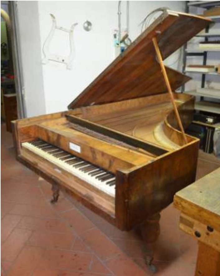
la bandella anteriore a chiusura è mancante